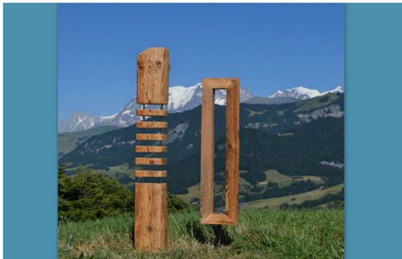
lampes "Au bois d'Olivier"

Enfin, le site présente également la société VM France , un concepteur de coffrets haut de gamme personnalisables ainsi que les très sympathiques créations de lampes design " Au bois d'Olivier ". Bon surf !