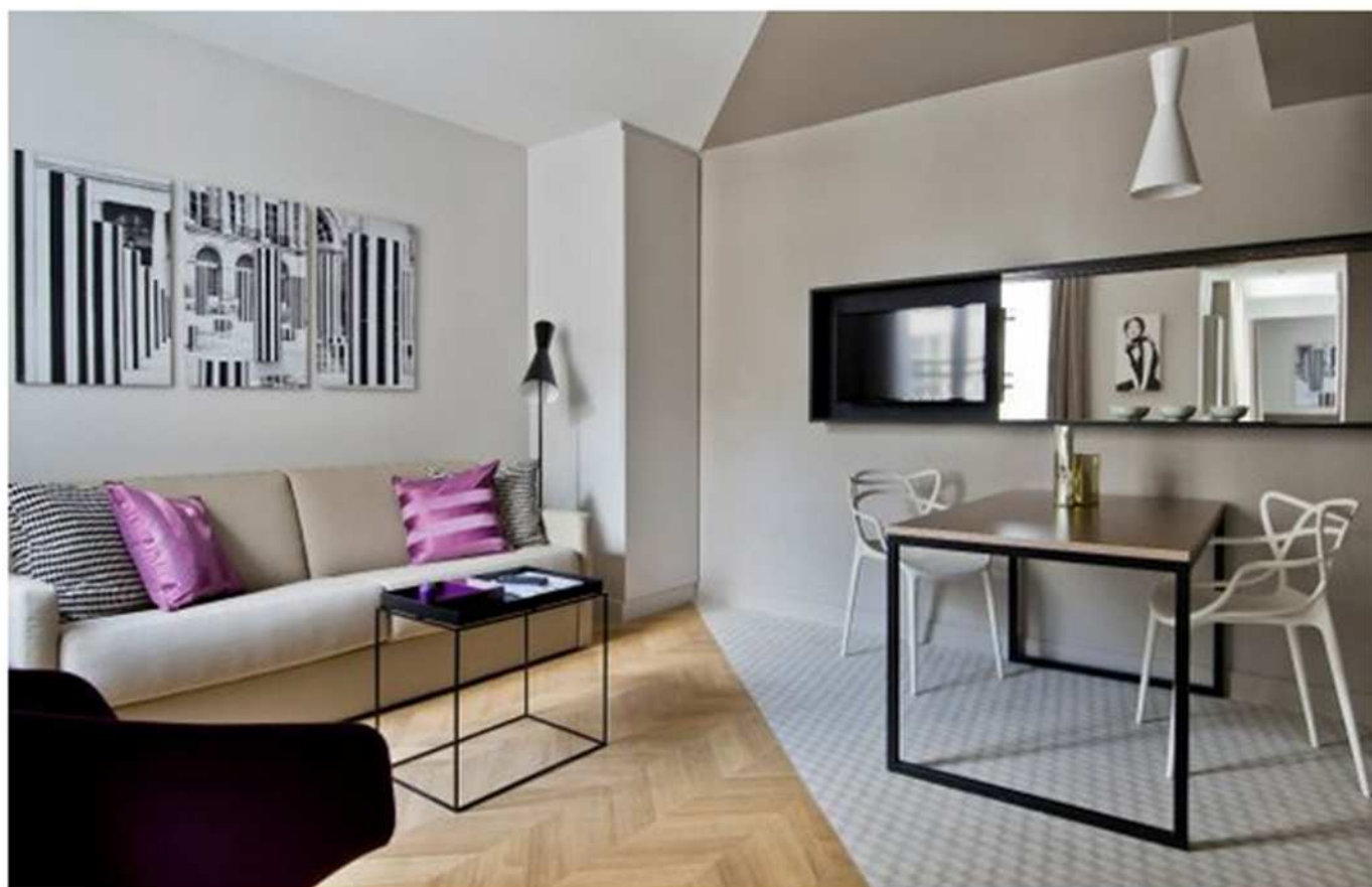
Fusion Interiors Group

Les galeries d'art sont fort bien représentées sur le site avec la présence de la Galerie genevoise Artvera's spécialisée dans les courants majeurs de la fin du 19ème, début du 20ème siècle. Sans oublier la société d'architecture d'intérieur et de conception graphique FUSION INTERIORS GROUP , basée à Londres et de renommée mondiale.